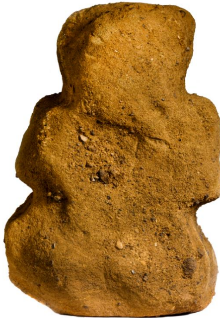
Mynd 2. Kross, höggvinn í stein, stóð við kirkjuna á Þórarinsstöðum. Lögur hans og gerð má rekja til N-Þýskalands, hvar erkibiskupsstóll Íslendinga var á 11. öld.

krossar hefðu verið höggðir í stein svo snemma á Íslandi. Botn þessa kross er flatur, líklega til þess að hann geti staðið einn og sér, en hann lá á hliðinni þegar hann fannst norðanmegin á kirkjustæðinu á Þórarinsstöðum. Engin gröf var þar nálægt. Hæð krossins er 45 cm (mynd 2).