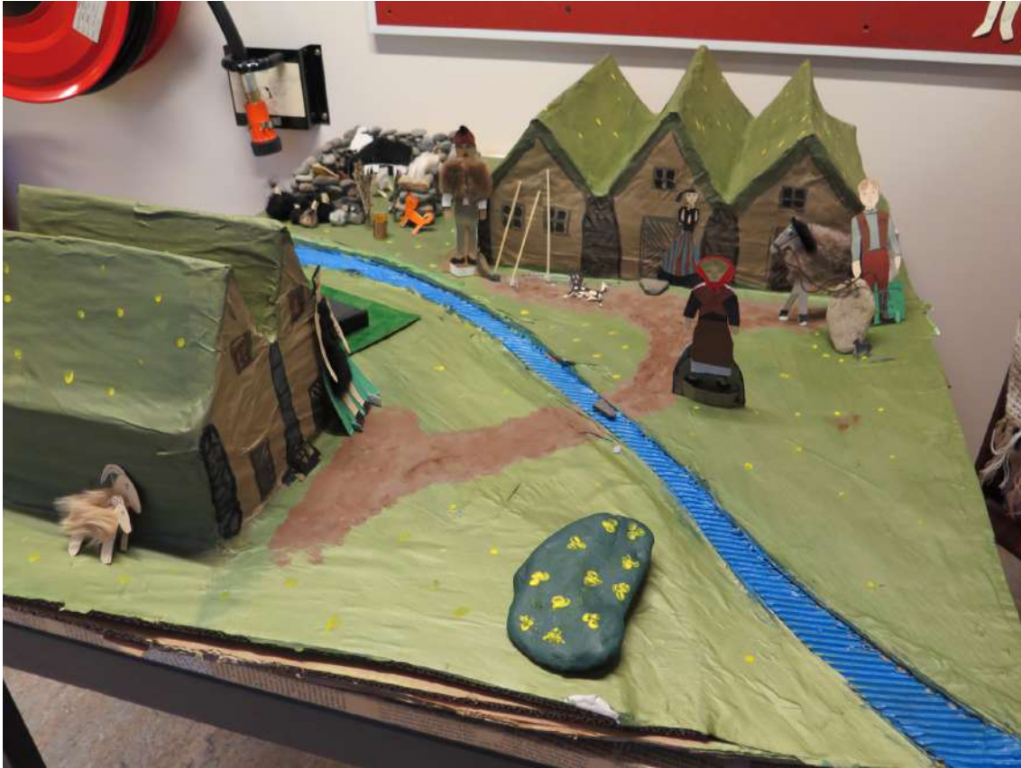
Mynd 3. Nemendaverkefni unnið úr endurnýttum efnivið.

Ýmis verkefni eru unnin árlega sem tengjast sjálfbærnimenntun. Eitt dæmi um það er verkefni sem unnið er á elsta stigi í svokölluðum við-tímum en það eru tímar sem falla undir lífsleikni og samfélagsgreinar og ná yfir tvær og hálfu kennslustund á viku. Verkefnið felur í sér að nemendur útbúa smáréttahlaðborð úr hráefnum sem þeir útvega sjálfir á haustin. Á hlaðborðinu er til að mynda sushi úr fiski sem nemendur veiða í Hörgá, jurtate úr jurtum sem þeir tína í nágrenni skólans og réttir með sveppum sem þeir hafa tínt og þurrkað. Þannig kynnast þeir nærumhverfi sínu og læra að nýta það sem þar er. Annað dæmi eru árlegir útivistardagar þar sem nemendur fara í dagsferðir á nokkra ólíka staði í sveitarfélaginu. Til að mynda er farið í fjallgöngur, hjólaferðir, fjöruferðir og gönguferðir. Á þessum dögum læra nemendur því að þekkja nærumhverfi sitt og tengjast samfélaginu sem þeir búa í. Þá ber einnig að nefna að hefð er fyrir að nemendur gróðursetji tré á skólalóðinni og víðar í nærumhverfi skólans. Umhverfisdagur hefur einnig fest sig í sessi í Þelamerkurskóla. Þann dag fá nemendur fræðslu og vinna ýmis verkefni á stöðvum sem tengjast umhverfismálum. Einn kennari segir: