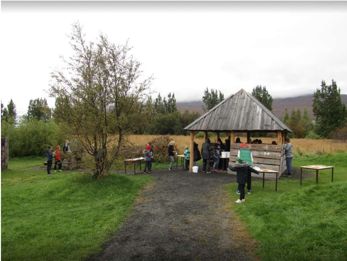
Mynd 2. Útiskólasvæði Síðuskóla.

Sjálfbærnimenntun tengist að miklu leyti Grænfánanum sem skólinn hefur flaggað frá því í apríl 2006. Árlega eru unnin þemaverkefni og má sem dæmi nefna verkefni um vistspor, vatn og endurnýtingu. Í nokkur ár hefur skólinn kosið að gefa jólagjafir sem tengjast þemanu hverju sinni til fátækra landa í stað þess að senda út jólakort. Til að mynda gaf skólinn brunn í Afríku þegar þemað var vatn.