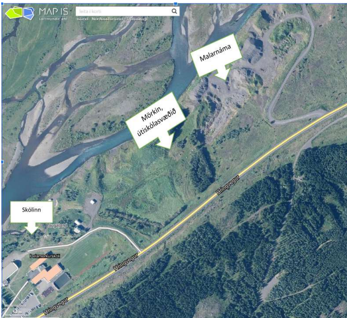
Mynd 5. Kort af vistheimtarsvæði.

Veturinn 2018–2019 hóf Þelamerkurskóli að vinna að vistheimtarverkefni í samstarfi við Landvernd, Norðurorku og sveitarfélagið Hörgársveit. Verkefnið felur í sér að græða upp gamla malarnámu skammt norðan við útiskólasvæði skólans. Markmiðin með verkefninu eru fyrst og fremst að skapa námstækifæri fyrir nemendur og græða upp landsvæði sem tekið hefur breytingum af mannavöldum. Nemendur taka virkan þátt í verkefninu en í upphafi var haldin hugmyndasamkeppni meðal þeirra um hvernig mætti byggja svæðið upp. Ýmsar hugmyndir voru settar fram og sáu nemendur meðal annars fyrir sér að útbúa fuglaskoðunarsvæði, göngu- og hjólastíga, hjólabrettarampa og snjóbotubrekkur sem þeir og íbúar sveitarfélagsins gætu nýtt til útivistar og heilsueflingar. Nú á öðru ári verkefnisins taka nemendur þátt í að koma upp ræktunarreitum og bera saman uppgræðslu á ólíkum svæðum með mismunandi jarðvegi. Gert er ráð fyrir að nemendur komi til með að taka þátt í áframhaldandi uppbyggingu á svæðinu næstu árin.