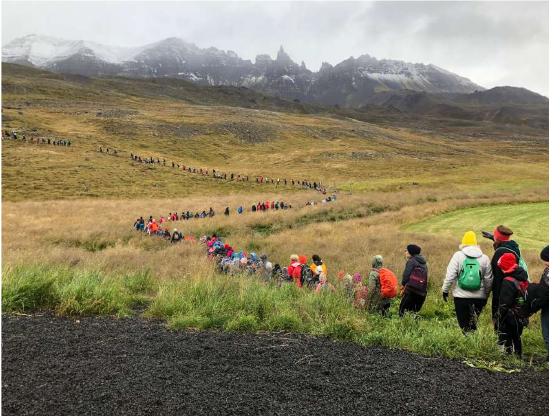
Mynd 1. Fjallganga upp að Hraunsvatni á umhverfisdegi.